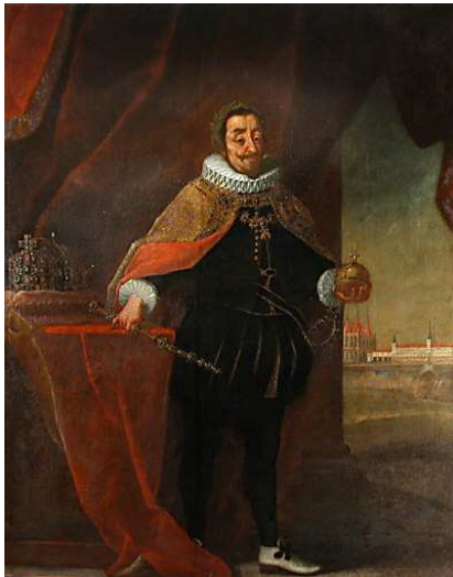
Císař Ferdinand II.