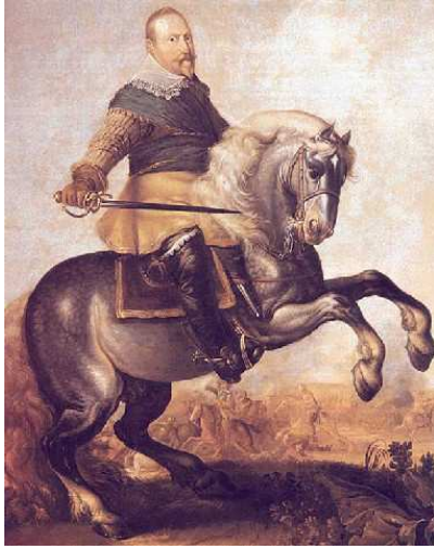
Švédský král Gustav II. Adolf